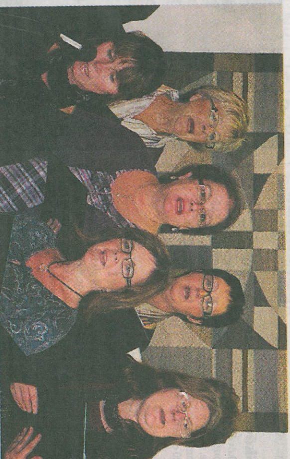
Våga Sjunga-kören i Stenstorps Pastorat firade fem år genom att bjuda in till allsång.